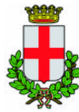
Comune di Padova